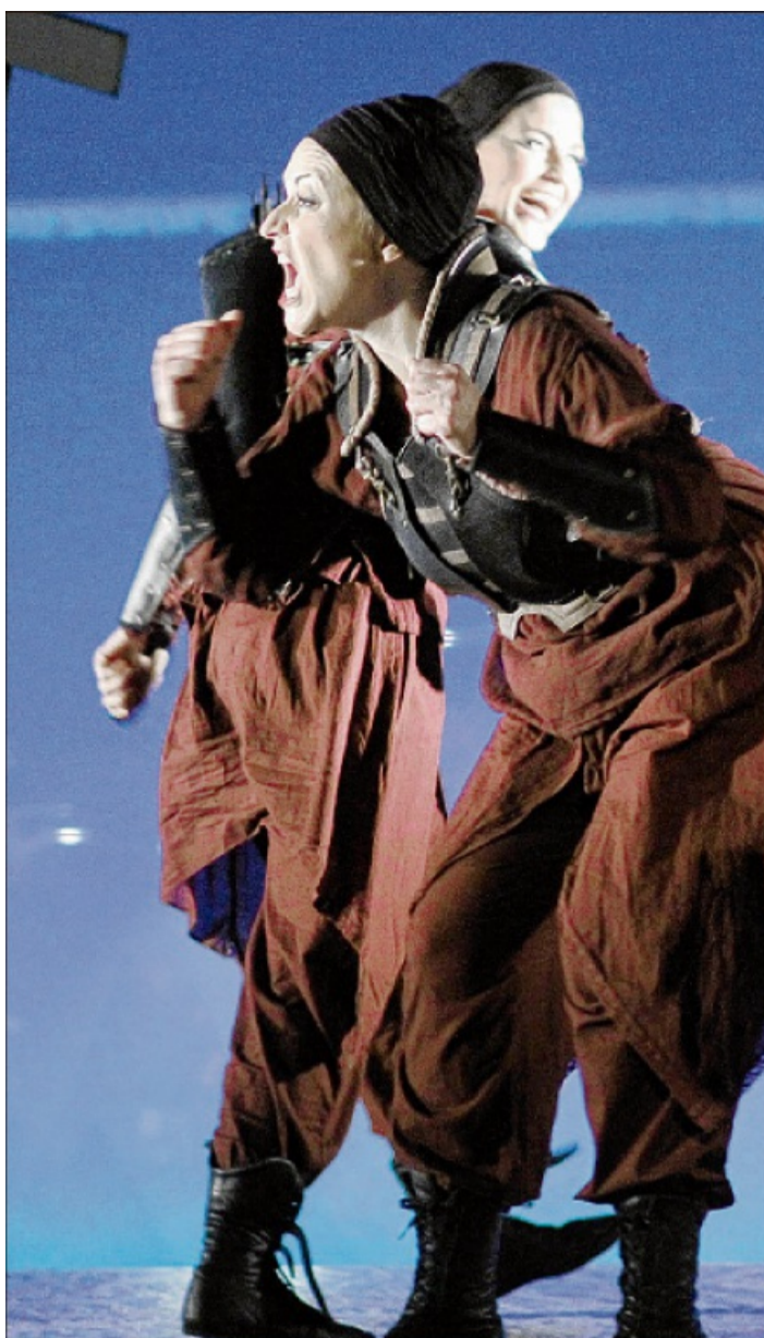
Anklänge mittelalterlicher Rüstungen und Waffen zeigen die Kostüme der Walküren.